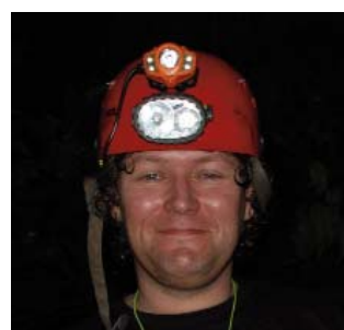
Auteur - David Eskes

Sinds 1999 ondergronds actief in Laos. Doet tegenwoordig meer aan canyoning maar moest dit jubileum, tien jaar speleologisch onderzoek in Noord Laos mee beleven. Voor de 2e keer mee met het Laos Cave Project.