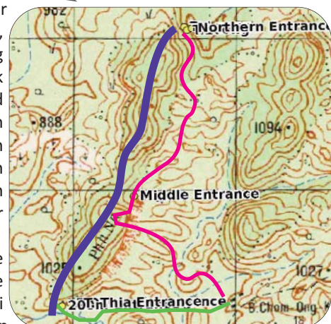
Ondergrondse rivier Wandelpad Chom Ong - TCO Ingang Wandelpad Chom Ong - TCO North Entrance

Midden in het dorp stopt de pickup en stappen we uit. Er staat een grote houten hut op palen, dit is het gastenverblijf dat vorig jaar speciaal voor de toekomstige toeristen is gebouwd. Ook zijn er een aantal waterkranen in het dorp geïnstalleerd evenals een sanitair gebouw, een toilet en een mandi bak douche. Ondertussen komt ook de tweede pickup binnenrijden. We laden al onze bagage uit en brengen het via een houten trapje ons guesthouse binnen. Het is tijd voor een lunch, in het binnenland natuurlijk geen stokbrood, maar gewoon gebakken rijst of kleefrijst met wat groente en kip. We zitten in een grote kring op de grond en proberen onze voeten vooral niet richting één van onze gastheren te laten wijzen. Een erg onbeleefd gebaar, op onverklaarbare wijze steken er even later twee eetstokjes in een kom rijst, dit is de